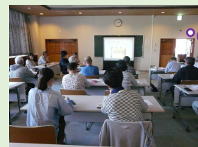
昨年の分析結果ご報告の様子② (果樹農業塾)

今年度果樹農業塾(ぶどう)参加者は 第4回、第5回講習会にて土壌採取/分析結果の報告を予定しています。