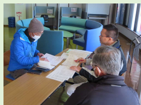
昨年の分析結果ご報告の様子①