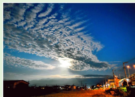
空一面のうろこ雲

撮影場所は旧玉穂地区上三条とのことです。背後にそびえる南アルプスを背景に右から伸びる新山梨県環状道路と左から伸びるうろこ雲が交わるような構図になっていて、雲の切れ目から明るい光がもれています。